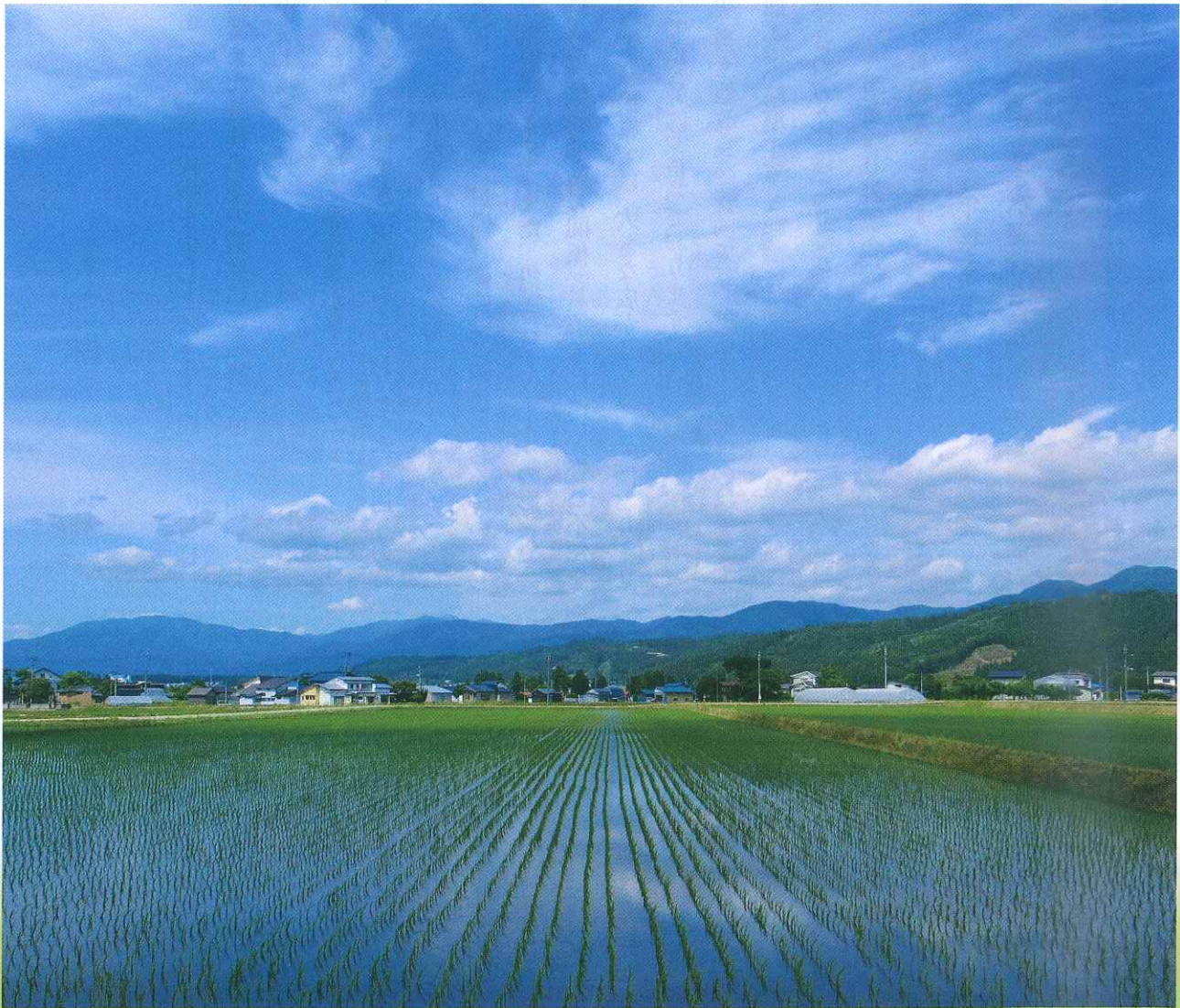
畑屋中央地区の圃場整備後の様子