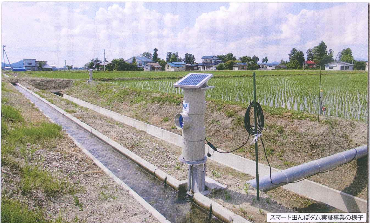
スマート田んぼダム実証事業の様子