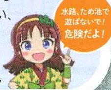
水土里ネット秋田 イメージキャラクターみどりちゃん

農作業が盛んとなる時期は、用排水路の水量が多くなり、流れも速く大変危険です。各地で子供の水難事故が起こっておりますので、用排水路やため池で遊ばないように大人の皆様から子供へ注意喚起を行い、水難事故防止にご協力をお願いします。