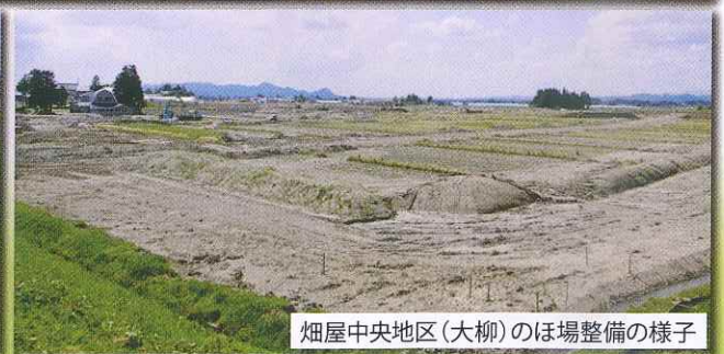
畑屋中央地区(大柳)のほ場整備の様子