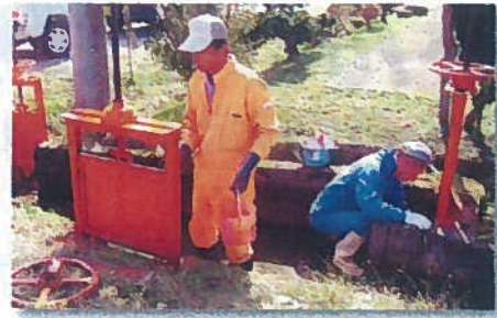
ゲート保守作業 (安城寺)