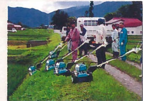
自走式草刈機試運転 (元本堂)