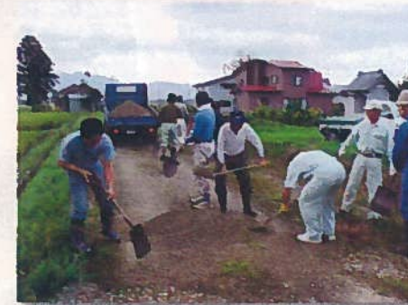
農道砂利敷設 (畑屋)