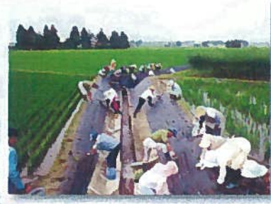
ヒメイワダレ草植栽 (千屋南部)