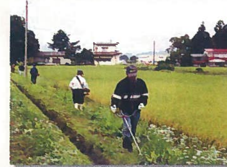
一苜草刈り作業 (塚)