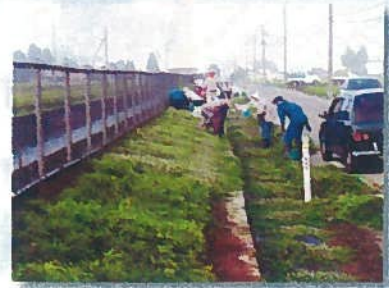
ヒメイワダレ草生育状況 (千屋北部)