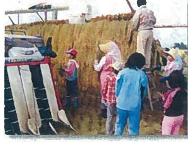
はさ掛け作業 (第二畷)