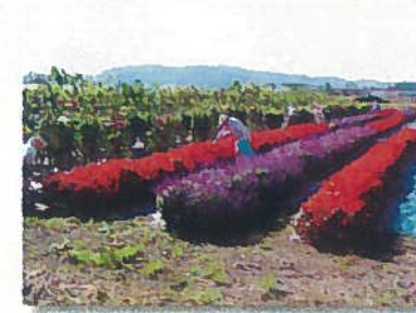
フラワーパーク (第二畷)