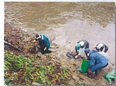
ため池水抜点検補修 (善知鳥)