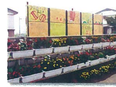
花壇とポスター看板 (善元寺)