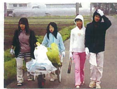
クリーンアップ (大畑)