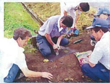
ヒメイワダレ草植栽講習 (土崎)