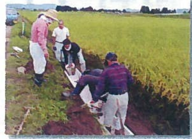
側溝施設修繕 (大柳)